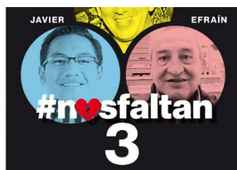
Imagen 5: Uso de hipervínculos

Vea también: A las 48 horas desistieron de liberar al equipo de El Comercio