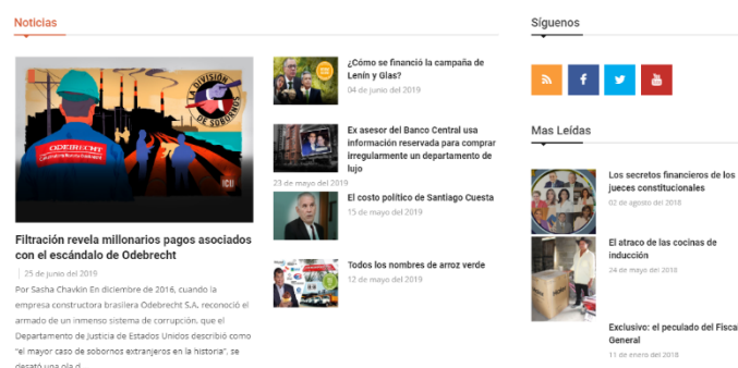
Imagen 1: Interfaz de home page

Los demás niveles de información muestran destacados de cada una de las secciones de la barra de navegación superior, con jerarquía informativa: construcción gráfica de la más actual o importante y entrada con titular, fotografía y lead, en los demás casos.